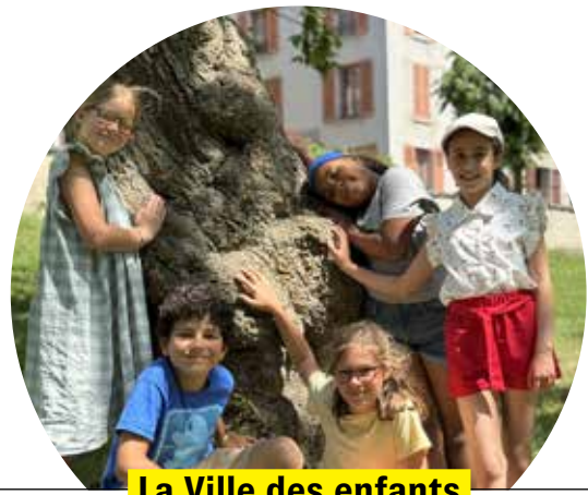
La Ville des enfants

Pour plus d'informations www.ville-pontoise.fr