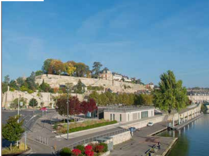
Les bords de l'Oise.