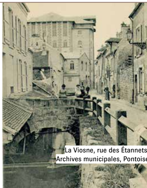
La Viosne, rue des Étannets.