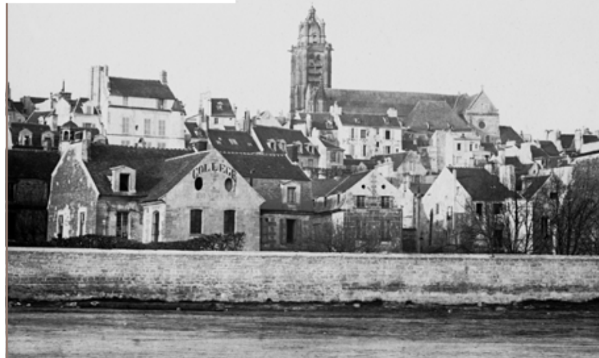
La Viosne rue Carnot en 1868.