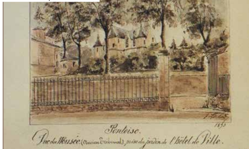
Jules Lebas, Vue du musée Tavet, Archives Municipales de Pontoise