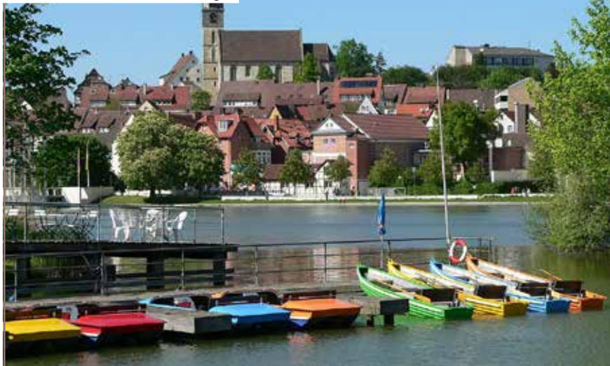
Vue de Böblingen, ville du sud-ouest de l'Allemagne